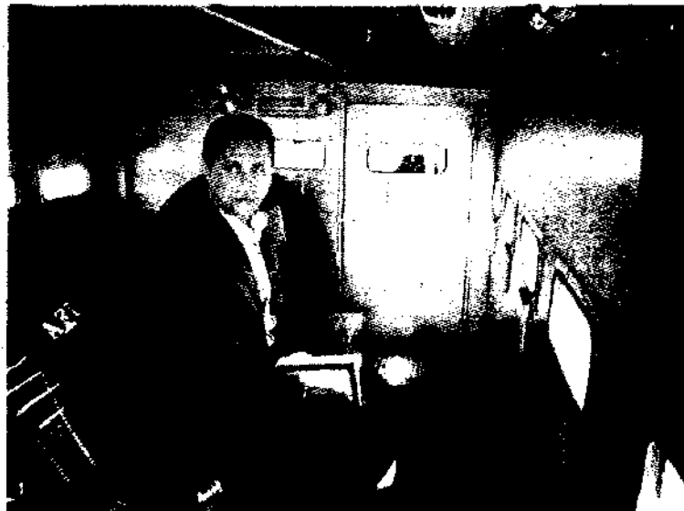
El ex aspirante del PRD-PT-Convergencia a la gubernatura de Quintana Roo es visto aquí antes de ser internado en el penal federal de Tepic por nexo con el narcotráfico entre otros delitos.

Añadieron que el objetivo del DIA es fortalecer el estado de derecho y las libertades políticas. "Pero consideramos que también es posible que esta historia termine en la anulación de la elección para gobernador en Quintana Roo".